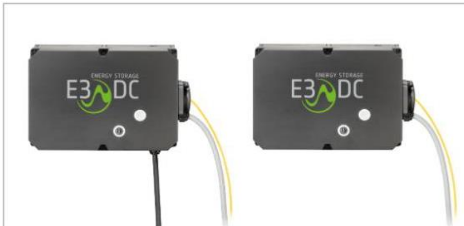
Abb.25 Verkabelte Wallboxen mit und ohne fest angeschlagenes Ladekabel